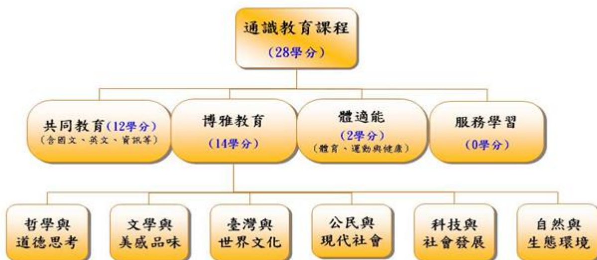
104學年度入學生通識課程架構圖